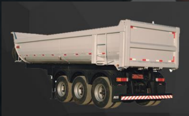
Caçamba meia cana